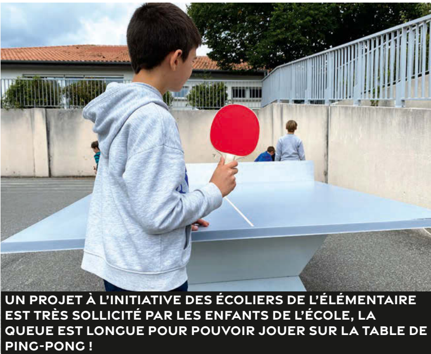
UN PROJET À L'INITIATIVE DES ÉCOLIERS DE L'ÉLÉMENTAIRE EST TRÈS SOLlicitÉ PAR LES ENFANTS DE L'ÉCOLE, LA QUEUE EST LONGUE POUR POUVOIR JOUER SUR LA TABLE DE PING-PONG !