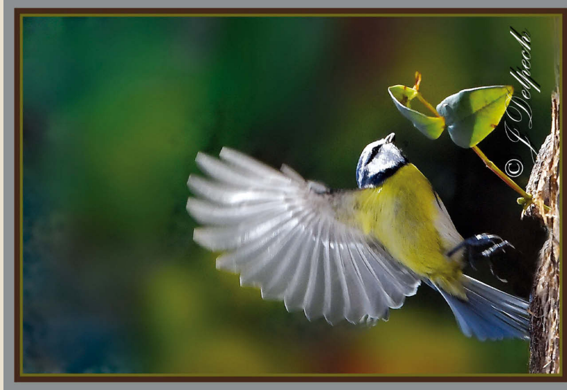
La Mésange Bleue