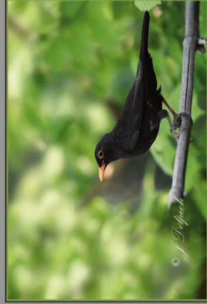
La Merle Noir