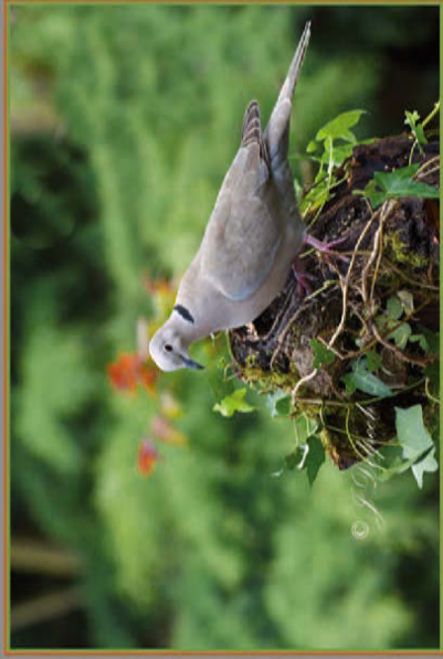
La Tourterelle Turque